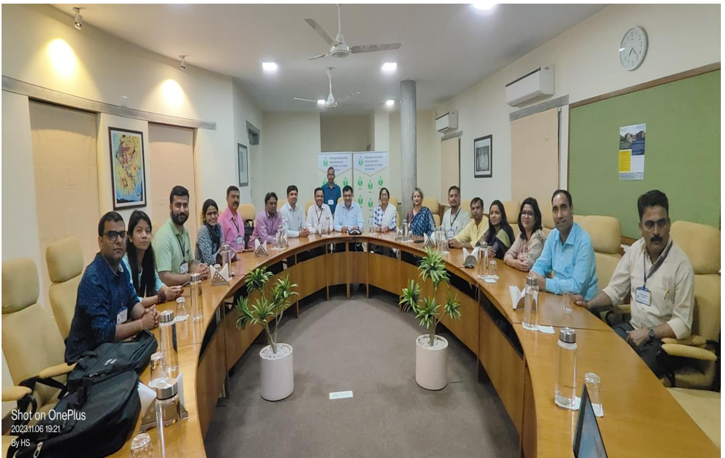
Participants of Faculty Mentor Development Program (FMDP)