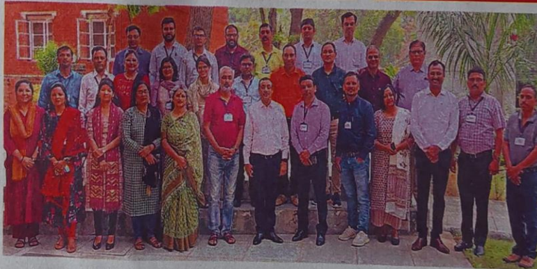
गुजरात के अहमदाबाद में देवभूमि उद्यमिता योजना मेंटर प्रशिक्षण में मौजूद महाविद्यालय के संकाय सदस्य • जागरण

• उत्तराखंड शासन की ओर से आयोजित हुआ पांच दिनी प्रशिक्षण