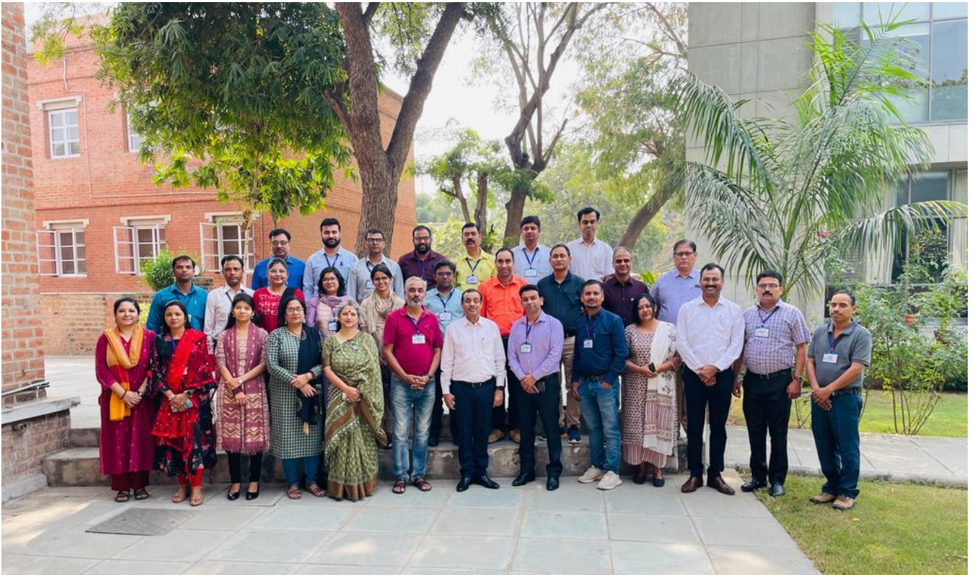
Group Photograph (Cohort-1)