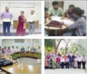
राजकीय महाविद्यालय देवप्रयाग में देवभूमि उद्यमता केंद्र की स्थापना का कार्यक्रम अंतिम संस्कार का दिन था।

देवप्रयाग, देवप्रयाग। राजकीय महाविद्यालय देवप्रयाग के संयोजक सचिव का प्रास्ताविक अंतिम संस्कार का दिन था।