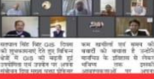
ज्योग्राफिक सोसायटी ऑफ सेंट्रल हिमालय एवं एसएसजे विश्वविद्यालय अल्मोड़ा के संयुक्त तत्वाधान में किया गया GIS दैवस का आयोजन।

देवप्रयाग, देवप्रयाग। ज्योग्राफिक सोसायटी ऑफ सेंट्रल हिमालय एवं एसएसजे विश्वविद्यालय अल्मोड़ा के संयुक्त तत्वाधान में किया गया GIS दैवस का आयोजन।