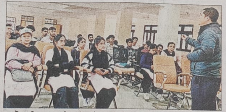
उद्यमिता विकास कार्यक्रम में स्वरोजंगार के टिप्स देते विशेषज्ञ।

परिचयात्मक सत्र के दौरान उन्होंने छात्र-छात्राओं से उनके बिजनेस आइडियाज के बारे में चर्चा की। उन्होंने सभी छात्र-छात्राओं से उनके अनुभव व व्यावसायिक रुचियों के