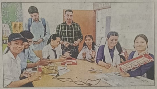
उद्यमिता विकास के तहत प्रशिक्षण प्राप्त करते छात्र-छात्राएं।

उन्होंने छात्र-छात्राओं को व्यावसायिक अवसरों को पहचानने के तरीके, अवसरों का मूल्यांकन,