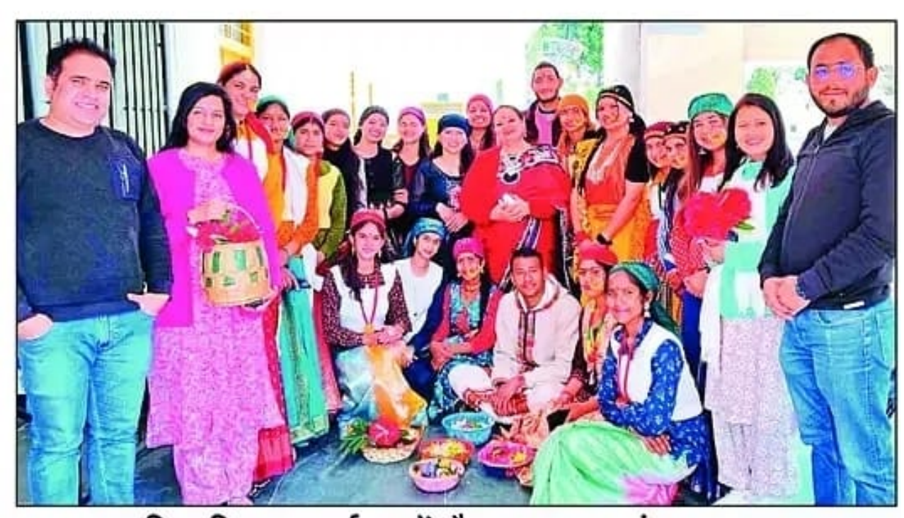
उद्यमिता विकास कार्यक्रम में मौजूद छात्र-छात्राएं व अन्य। संवाद