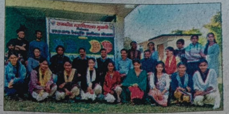
मुवानी महाविद्यालय में उद्यमिता प्रशिक्षण के दौरान उपस्थित विद्यार्थी, प्रशिक्षक। संवाद