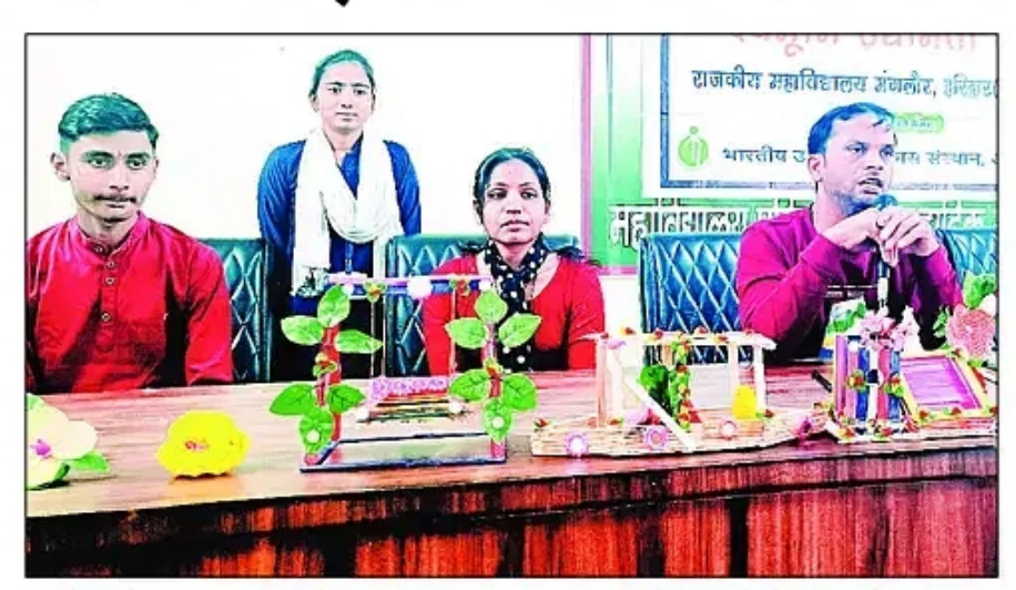
मंगलौर स्थित राजकीय महाविद्यालय में हस्तशिल्प विधि कार्यक्रम के दौरान छात्रों को सजावटी सामान बनाना सिखाया गया। - संवाद